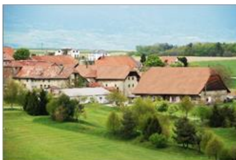
Vue du village de Vuissens

Dossier aux conditions d'approbation en cours (2021)