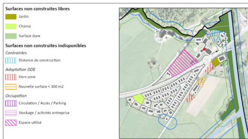
Réserves théoriques : analyse de l'occupation du sol