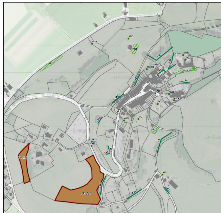
Localisation des biotopes