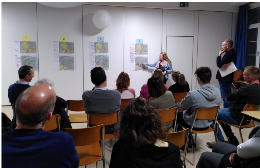
Synthèse finale de l'atelier