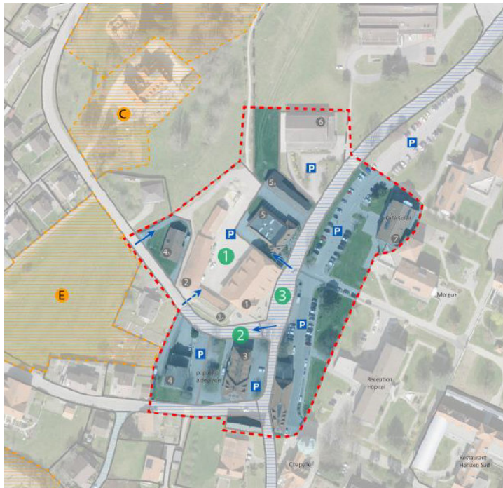
Plan de travail pour l'atelier